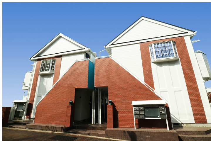
FUNDROP2号ファンド「東京都板橋区レジデンスアパート」