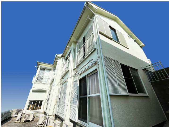
FUNDROP 4号「東京都北区」賃料保証×年利5%