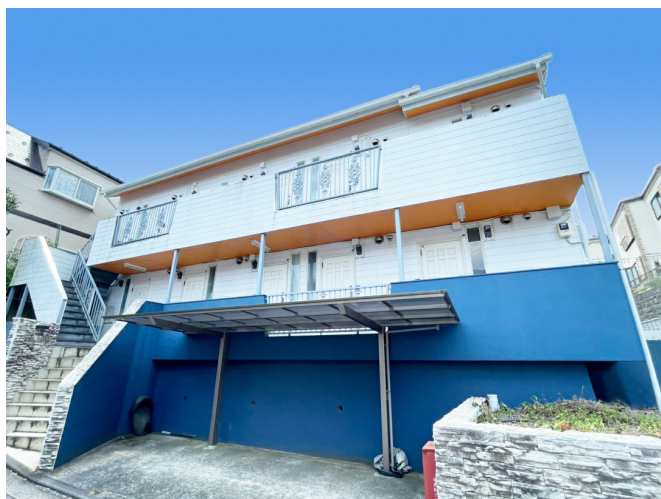
FUNDROP1号ファンド「横浜市旭区レジデンスアパート」

https://fundrop.jp/investment/investment_entry.html?fund_id=6&command=new&utm_source=pr&utm_medium=referral&utm_campaign=220301