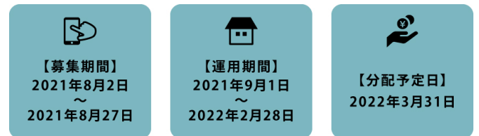
FUNDROP1号ファンドスケジュール